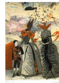
Série Bonnes fées . 2016 Encre, encre de chine et collage Fabienne Cinquin