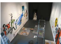
Résidence au musée Septembre 2020 Fabienne Cinquin