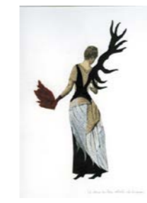
La dame au bois volant . 2016 Encre, encre de chine et collage Fabienne Cinquin