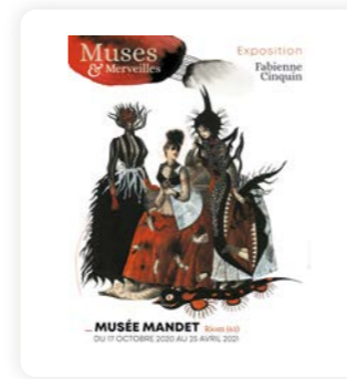
Exposition Muses et Merveilles 2020-2021