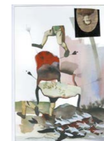
Fauteuil . 2019 Encre, encre de chine et collage Fabienne Cinquin