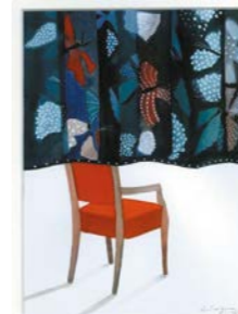
Rideau . 2019 Encre, encre de chine et collage Fabienne Cinquin