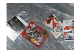
Résidence au musée Septembre 2020 Fabienne Cinquin