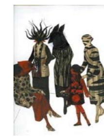
Bonnes fées . 2016 Encre, encre de chine et collage Fabienne Cinquin