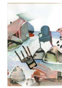
Etats de chaises . 2019 Encre, encre de chine et collage Fabienne Cinquin