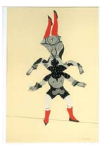
Couple acrobate . 2020 Encre, encre de chine et collage Fabienne Cinquin