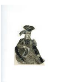
Monsieur Perruquier . 2018 Encre, encre de chine et collage Fabienne Cinquin