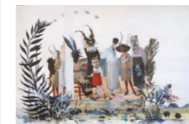
Parade . 2017 Encre, encre de chine et collage Fabienne Cinquin