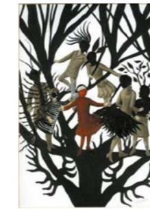
Série Bonnes fées . 2016 Encre, encre de chine et collage Fabienne Cinquin